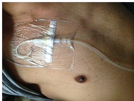
Photographie d'un cathéter

Ce dispositif peut rester en place plusieurs mois. Il permet, en plus de l'administration de médicaments, d'effectuer des prises de sang sans piqure. Le cathéter est protégé par un pansement, que votre infirmière refera selon le protocole de l'hôpital. Au domicile, une infirmière libérale pourra venir effectuer ce soin 1 fois/semaine. Le cathéter ne doit pas être mouillé ou manipulé par un non professionnel du fait de risque d'infections entre autre.